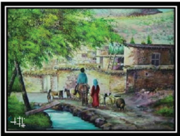
نمایی از روستای زادگاه هنرمند، ۵۰×۷۰، رنگ روغن