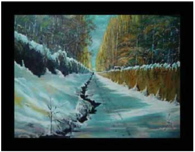
زمستان در سنندج، ۵۰×۷۰، رنگ روغن