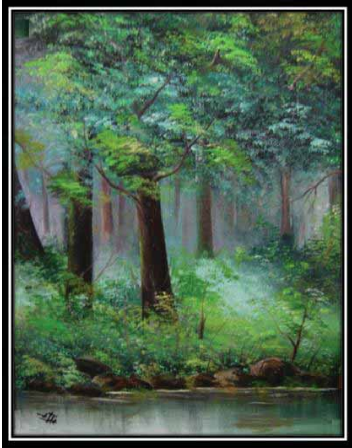
طبیعت، ۵۰×۷۰، رنگ روغن ▼