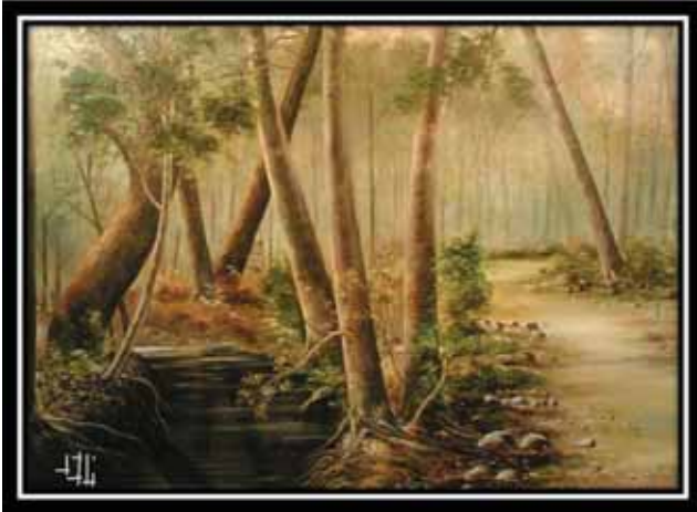
طبیعت کردستان، ۵۰×۷۰، رنگ روغن