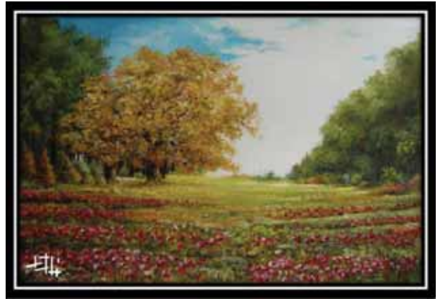
در آستانه پاییز عاشق، ۵۰×۷۰، رنگ روغن ▲