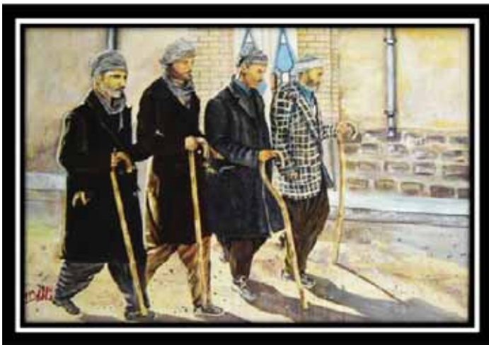
پیرمردان کردستان، ۵۰×۷۰، رنگ روغن ▲