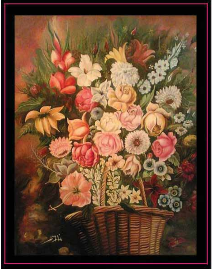
سیدگل، رنگ روغن